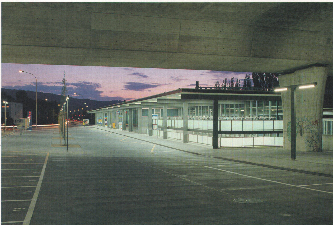
Bilder: Andrea Heibling