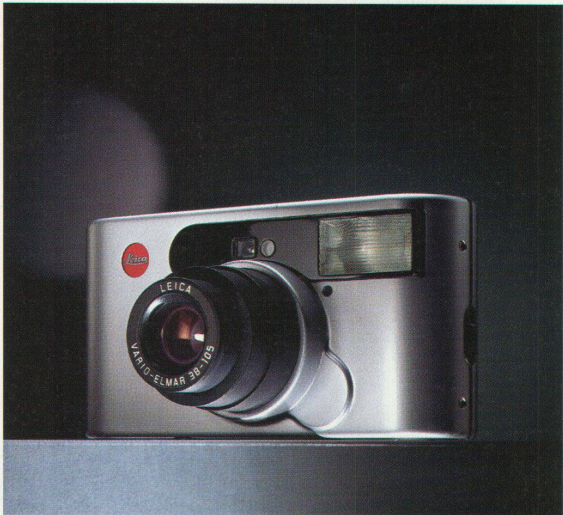
Die neue Leica C1 Kompaktkamera mit Aluminiumgehäuse, gestaltet von Klaus-Achim Heine

Hochparterre 6-7/2000 erscheint am 14. Juni 2000.