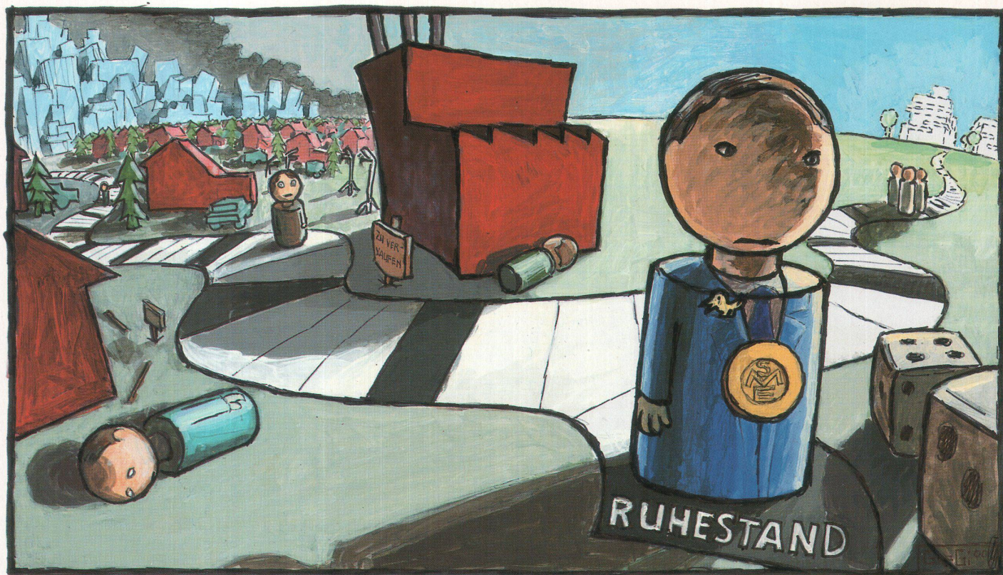
Illustration: Gregor Gilg