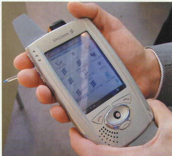
Videos, Internet, Fax und Telefon, das alles steckt in den Handys der Zukunft

Hochparterre 5/2000 erscheint am 10. Mai.