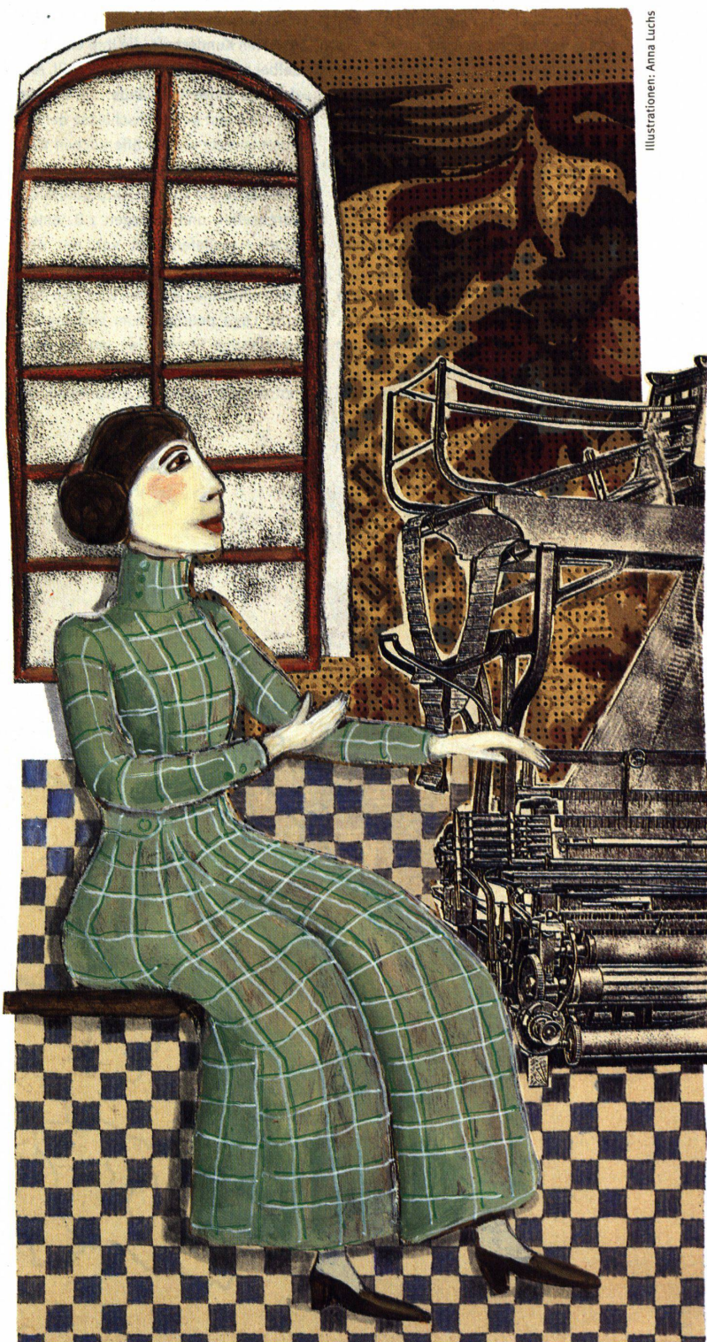
Illustrationen: Anna Luchs

Sehen wir uns in Langenthal um: In einer Shedhalle, in der früher Webstühle der Firma Gugelmann ratterten, präsentiert seit letztem November ein M-Parc seine Artikel. Die Migros hatte das