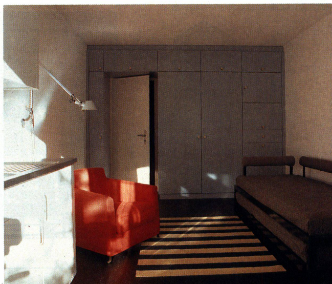
Die Kastenwand an der Stirnseite lässt dem Raum Breite, der Zebrastreifen-teppich gibt den Durchgang frei