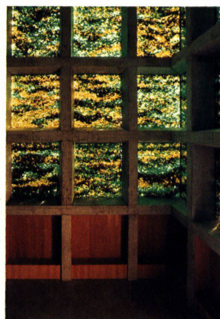
Die Scherbenfenster von innen