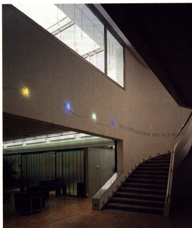
Die Zahlen und Abzählreime führen durch das Haus