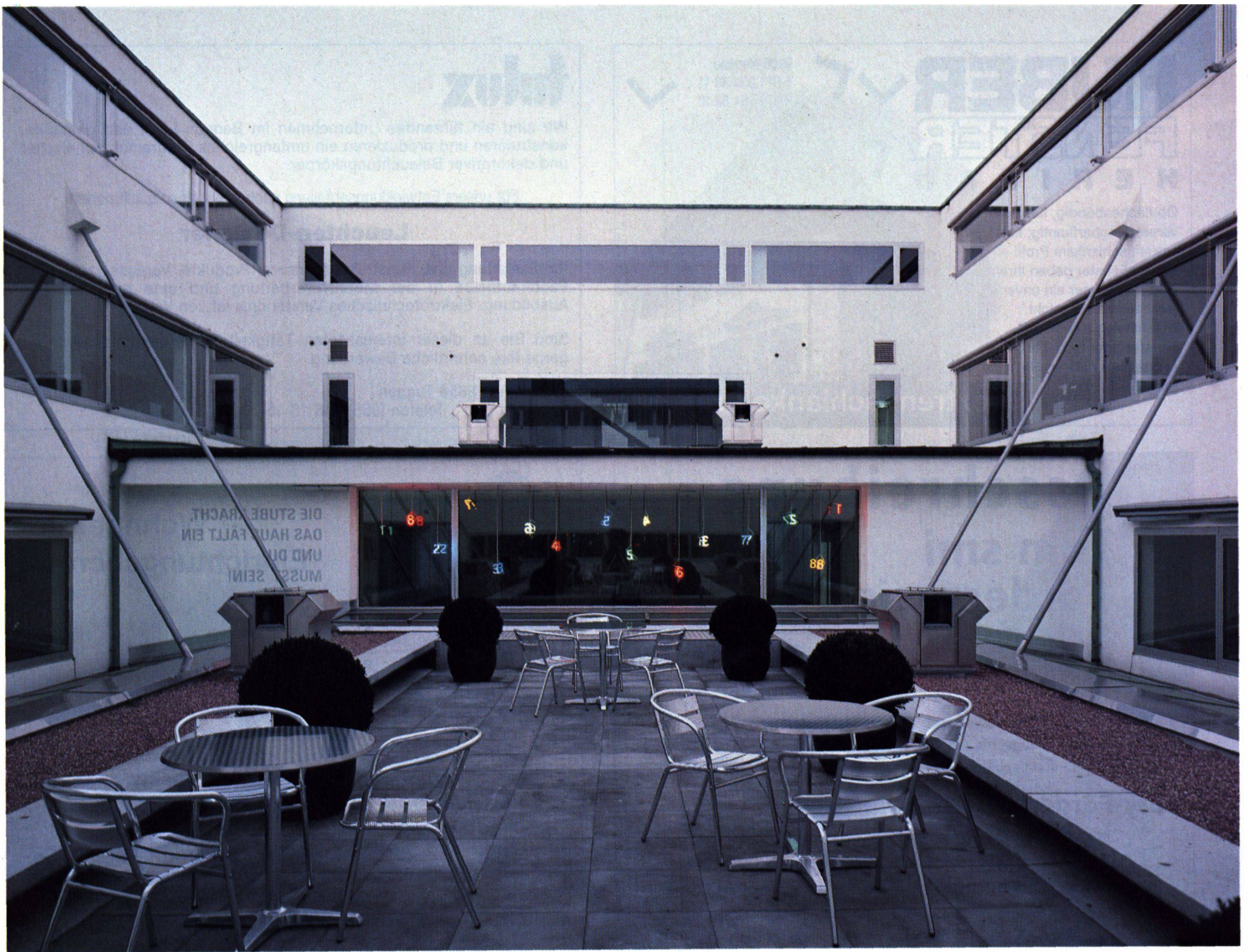
Auf dem hängenden Hofdach können sich die Bankangestellten erholen und für einmal dem kindlichen Zahlenspiel nachgehen