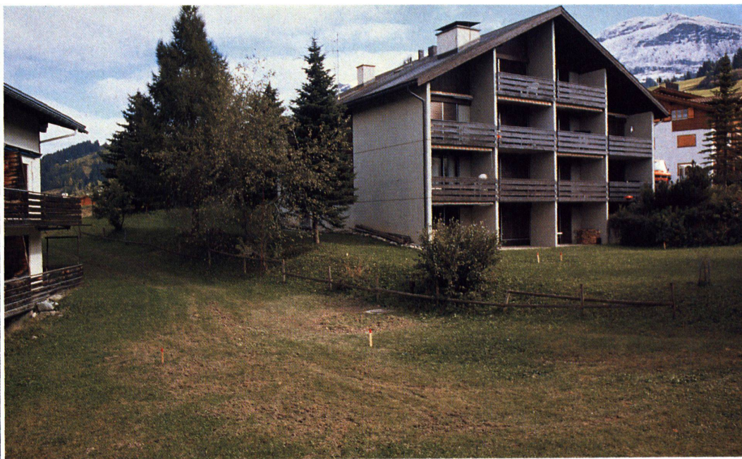
Viele Ferienchalets sind in die Jahre gekommen, die dunkel gebeizten Läden sind geschlossen und ein Schild «Zu verkaufen» hängt im Fenster z. B. in Obersaxen