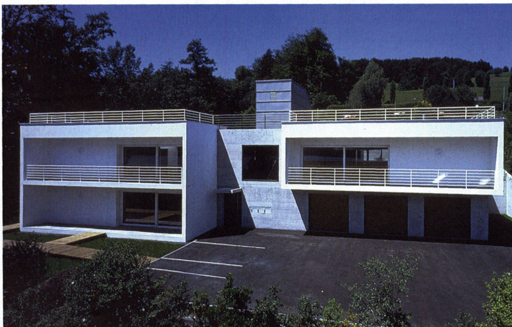
Ein mediterranes Haus in Merlischachen. Zwei weisse Kuben sind an das Treppenhaus gefügt