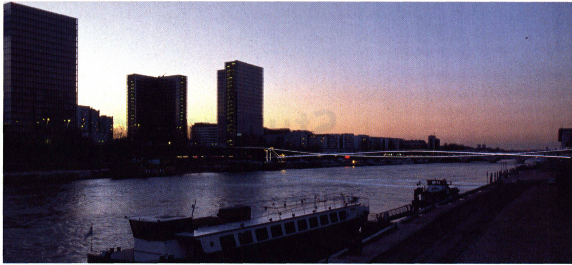
Rendering: Eddie Young

Rendering von Feichtingers Fussgängerpassarelle über die Seine. Links die Nationalbibliothek von Perrault