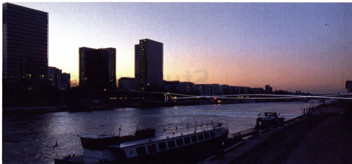
Rendering: Eddie Young

Rendering von Feichtingers Fussgängerpassarelle über die Seine. Links die Nationalbibliothek von Perrault