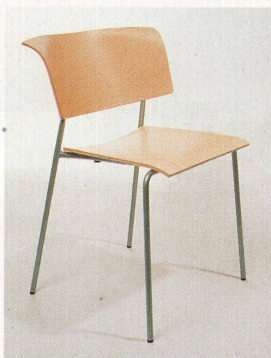
«Qvintus» mit breiter Rückenlehne

überbewertet, durchbrochen und setzte auf eine internationale Linie. Und wurde prompt kritisiert, als er 1987 mit dänischen Designern zusammenarbeitete. Die neue Stuhlgeneration mit «Campus», «Virtus», «Qvintus» und «Corpus», die inzwischen mehr als 60 Prozent des Umsatzes ausmacht, haben Peter Hjort-Lorenzen und Johannes Foersom entwickelt; beides Möbeldesigner aus Kopenhagen, der Einfachheit verpflichtet und vom Schiffbau und der Möbelschreinerei geprägt. Möbel sollen sich leise in die Architektur einfügen und lange leben. Auch formal ist die Besinnung auf solche Qualitäten der frühen Moderne ablesbar.