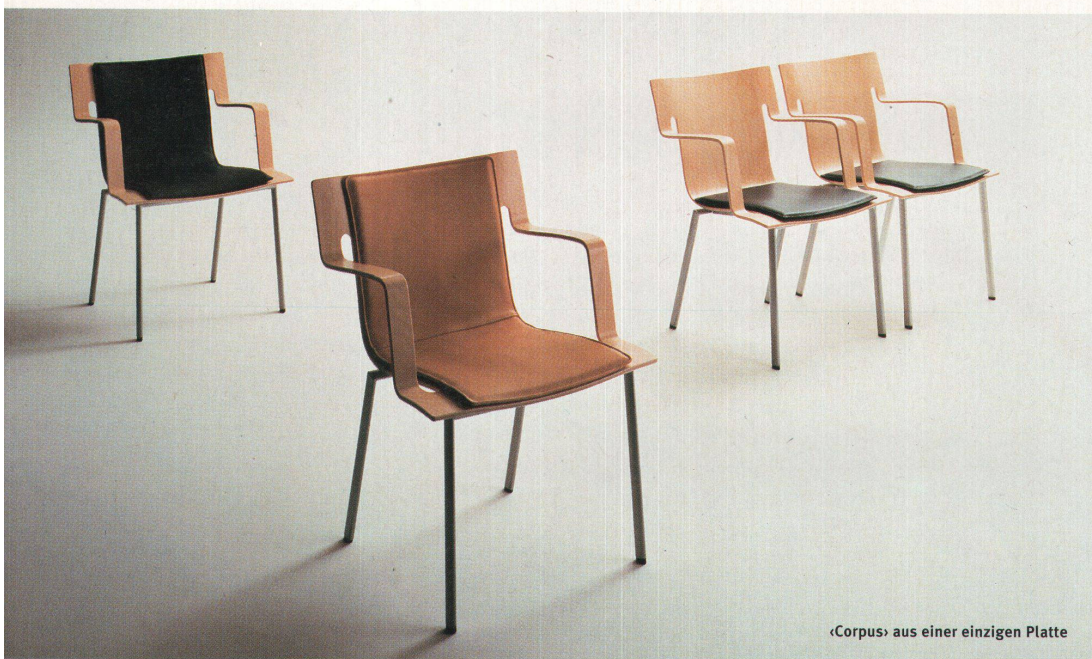
«Corpus» aus einer einzigen Platte