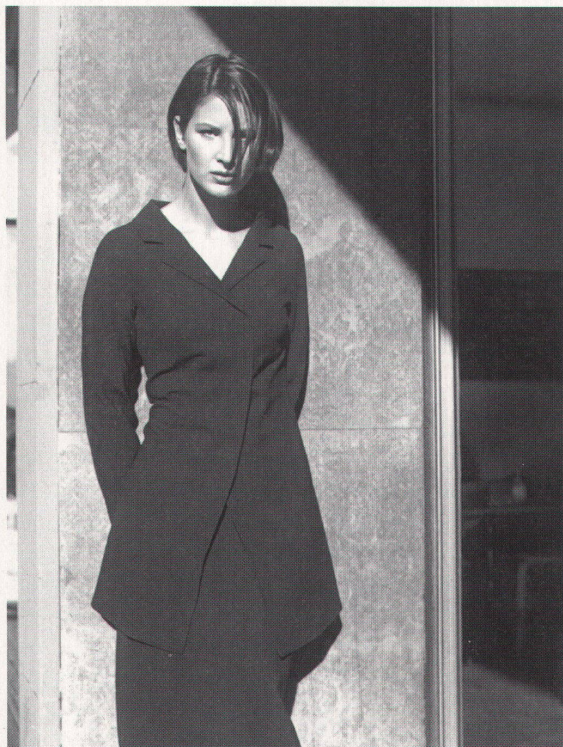
Ein Ensemble aus Jacke und Wickeljupe aus Wolle-Georgette der Modemacherinnen von Viento, die kürzlich einen Werkbeitrag des Kantons Bern erhalten haben

Hochparterre 3 erscheint am 4. März 1998