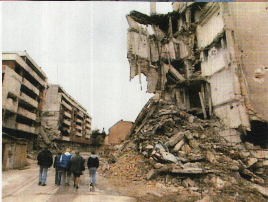
Die Schweizer Schülergruppe in Sarajewo