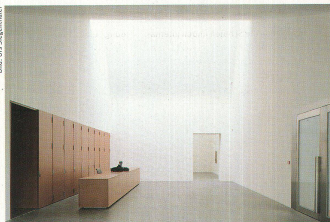
Shedhalle für Appenzell: Das Museum Liner

Illustrierte für Gestaltung und Architektur