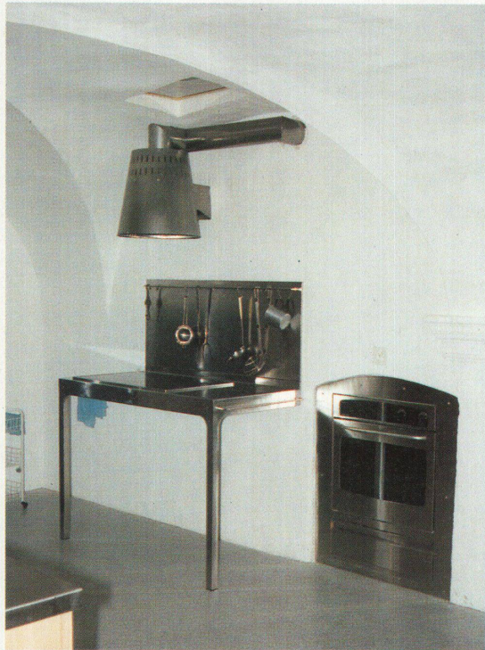
Verschiedene Zeitschichten nebeneinander: Der Kochherd in der Chesa Perini in La Punt

Hochparterre 10/98 erscheint am 7. Oktober.