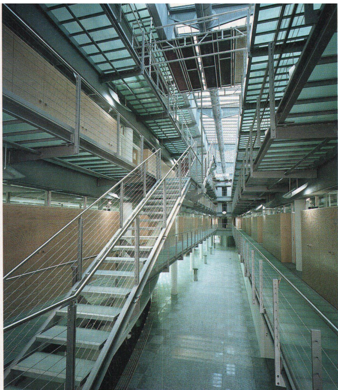
Der Lichthof im Innern der Titanic. Durchblick vom 1. Obergeschoss bis zum obersten Stock

turm in die Lücke. Die ursprüngliche Bauflucht an der Kreuzung wird durch das Vorkragen der Obergeschosse angedeutet.