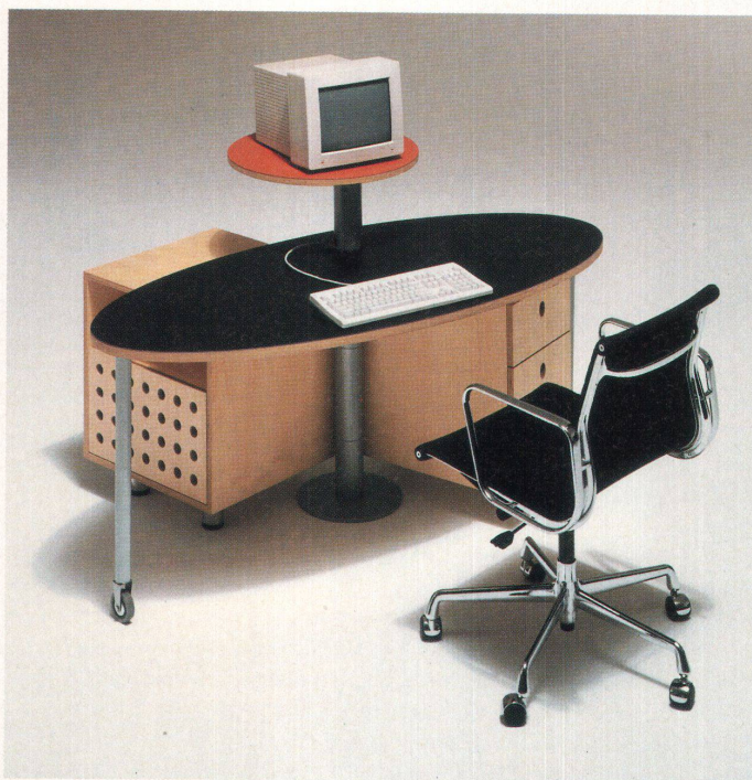
«Opus» – das Heimbüro zum Entfalten, entworfen von Markus Stucki für die Wohnhilfe

Die Wohnhilfe ist schon seit mehr als fünfzig Jahren in der Möbelszene tätig. Ursprünglich gründeten sie kreative und tatkräftige Schreinermeister aus der Ostschweiz als Selbsthilfeorganisation. Neben dem Verkauf gängiger Marken entwickelt sie auch eigene Möbel. Einer oder mehrere der sechs Inhaber produziert sie dann in seiner Werkstatt.