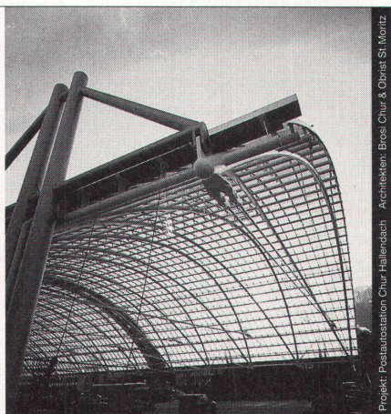
Projekt: Postautostation Chur Hallerbach Architekten: Brossi, Chur & Oetli St. Moritz

Stahl-Glas-Konstruktionen in architektonisch perfekter Vollendung verwirklichen wir mit innovativen Ideen und höchsten Anforderungen an Materialien und Ausführung.