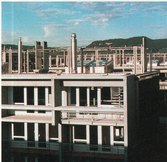
Die Siedlung Baumgarten in Bern

«Hochparterre» Nr. 6-7 erscheint am 11. Juni 1997