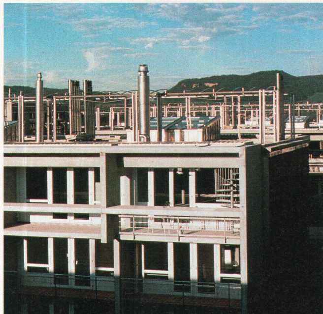
Die Siedlung Baumgarten in Bern

«Hochparterre» Nr. 6-7 erscheint am 11. Juni 1997