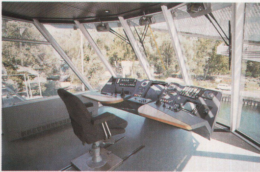
Steuerhaus mit Sonnenschutz