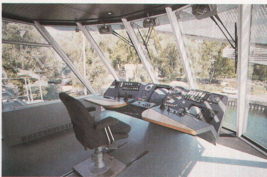
Steuerhaus mit Sonnenschutz