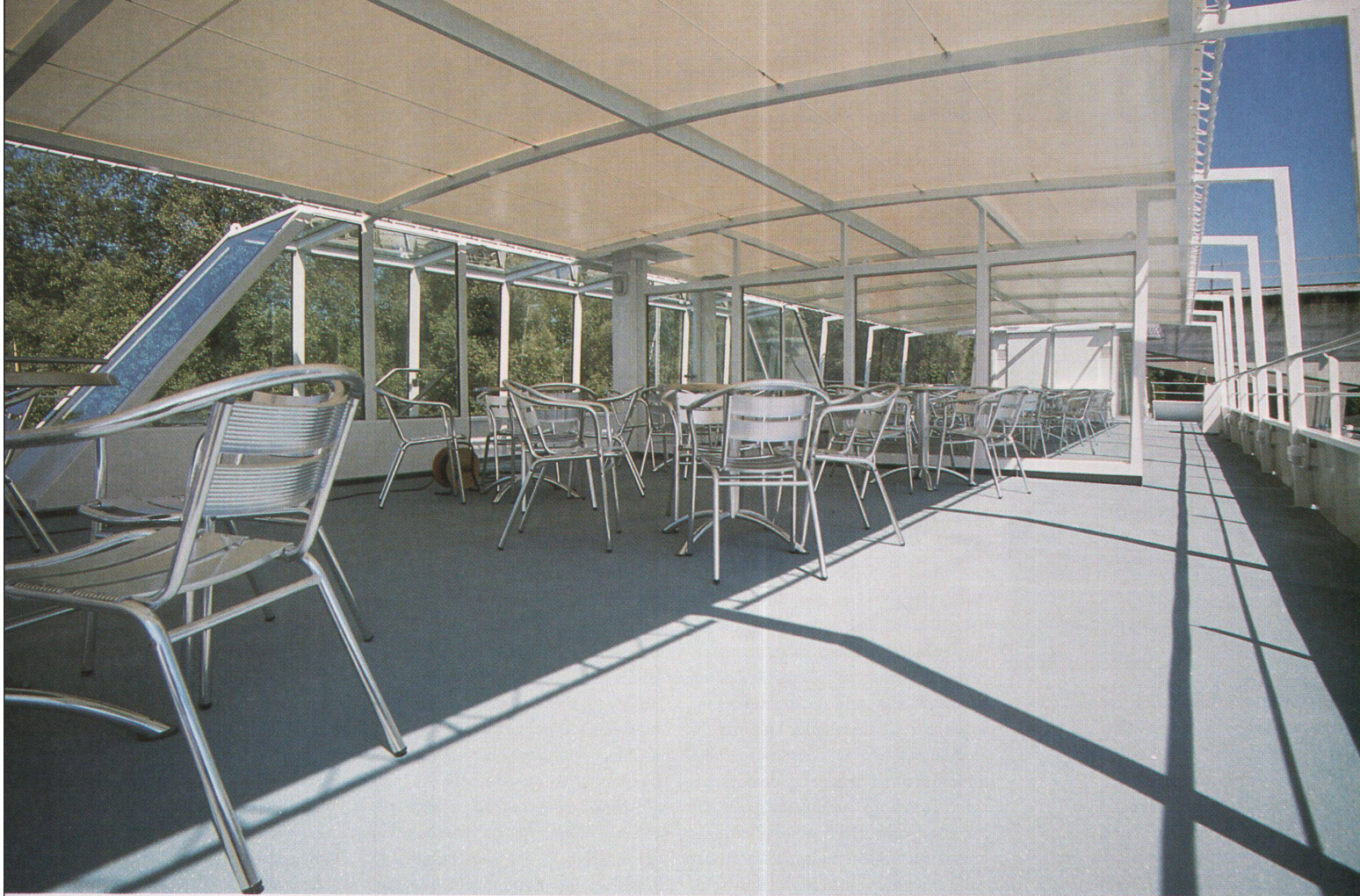
Sonnendeck mit Persenning und gläserner Querwand als Windschutz