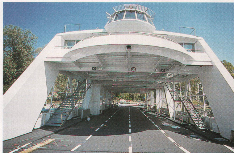
Wie eine Brücke spannt sich das Oberdeck über das Autodeck

Antriebstechnik, Beladungsprinzip, Abmessungen und Tragfähigkeit