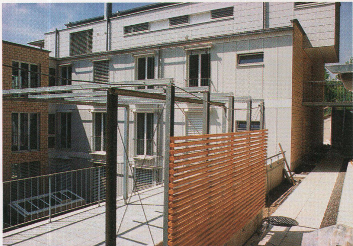
Hofseite der Wohnüberbauung «Im Sydefädel» in Zürich von ADP