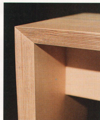
Die Kanten zeigen die verschiedenen Schichten des Birken-Multiplex

Die alten, klassischen, bunten Blechtische sind Liebhaberstücke, die rar