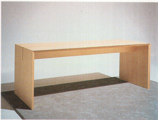
Den Tisch «Pro Nomos 05/30» haben Arndt und Herrmann entworfen

Ob im Esszimmer, in der Küche oder im Wohnraum, die Platte mit dem Unterbau darf nicht fehlen. Wir bitten zu Tisch und haben diesmal unser Augenmerk auf die Tischplatten gerichtet. Diese sind schlicht in Form und Material.