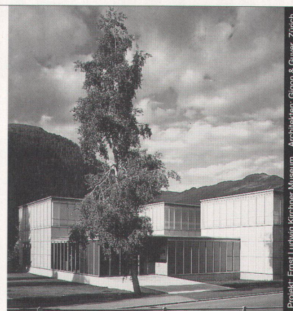
Projekt: Ernst Ludwig Kirchener Museum Architekten: Gigen & Guyer, Zürich

Ästhetik, Wirtschaftlichkeit und bauphysikalische Anforderungen in Einklang zu bringen, ist das Ergebnis ausgereifter Konstruktionen. Qualitätsbewusstsein und partnerschaftliche Zusammenarbeit sind nur einige der Voraussetzungen für ein gutes Gelingen in dieser vielfältigen Branche.