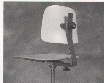
Dynasit-Class: Dank dem patentierten Kippmechanismus sitzen die Schülerinnen und Schüler in jeder Lage ergonomisch richtig.