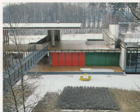
Kunst-Achse hangabwärts mit Erntehäuschen

Den Niveausprung im Turnhallentrakt vermitteln Ursula Hirschis Pfeiler