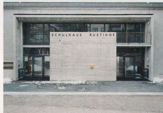
Eingang mit goldener Samenkapsel

Kunst am Bau heute sein kann – eine Frage, die seit Beginn der Moderne immer wieder neu ansteht. Bis dahin war der Zusammenklang zwischen Kunst am Bau und Baukunst traditionell geregelt: Allerlei Göttersleut', Wasserspeier und Rankenwerk besiedelten die Fassaden. Seit jenes Koexistenzmodell am Ende ist, fehlt eine verbindliche, verbindende Vorstellung von der Beziehung zwischen Bau und Kunst: oft erscheint Kunst am Bau als zusammenhanglos dem Bau Hinzugefügtes. Hirschi bietet eine seltene Antwort an: Ihre Kunst nimmt strukturell zum Bau Beziehung auf, indem sie sich selbst architektonisch verhält. Sie reflektiert, kommentiert und unterstreicht dabei die Architek-