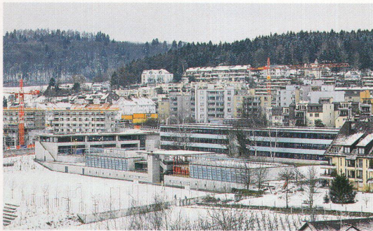
Übersicht von der Talseite, vorne die Turnhallen, links Kindergärten und Gemeinschaftsräume, hinten Schulhaustrakt

Das Schulhaus Rütihof in Zürich, gebaut von Furter Eppler Stirnemann aus Wohlen, bietet ein variantenreiches Raumgewebe. Der Bau, klar und spannungsvoll zugleich, wird durch die Kunst von Peter Hauri und Ursula Hirschi unterstützt.