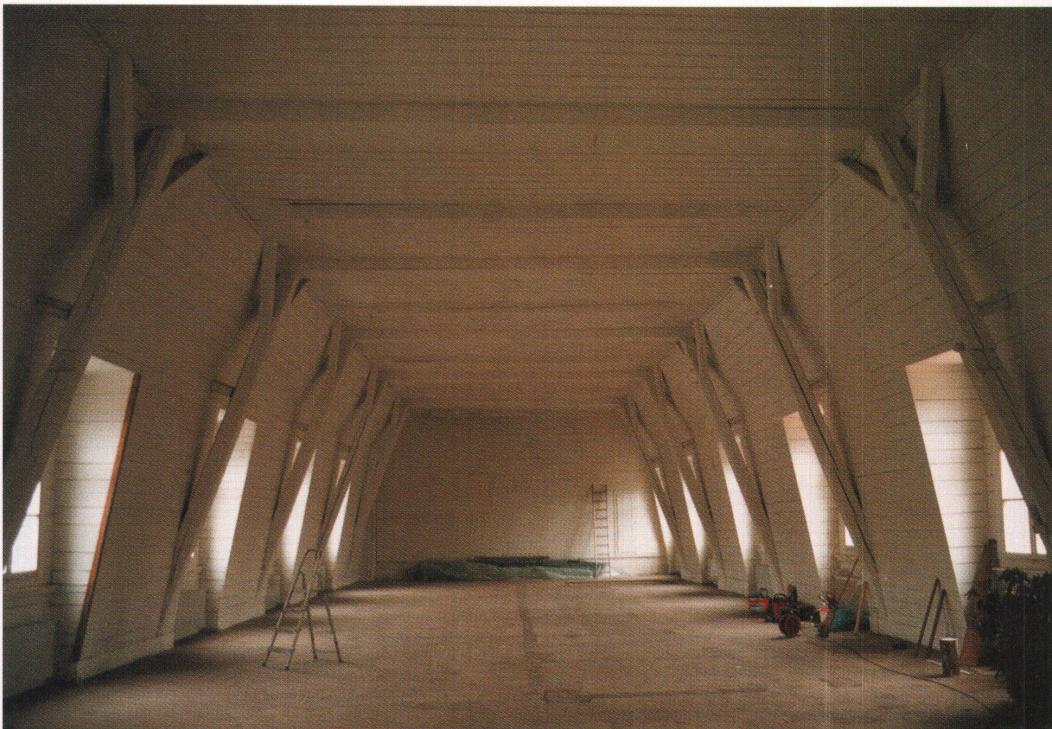
Inneres des «Kuppelbaus» aus dem Jahre 1915 vor dem Einbau der Arbeitsplätze