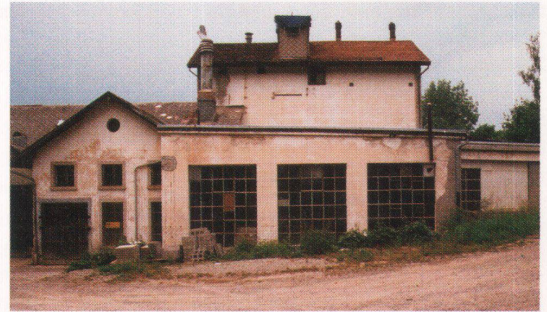
Aus dem Konglomerat entstanden eine Wohnung, Kleingewerbe und Ateliers

Fabrik um. Dabei zeigte sich, dass weit mehr der alten Bausubstanz als anfänglich gedacht noch gebrauchstüchtig war. Wer mit handwerklichen Methoden und ohne falschen Leistungsdruck an eine Sanierung herangeht, entdeckt den pfleglichen Umgang mit den Altbauten von selbst. Es gilt die Hausvaterregel: Nichts wegwerfen, was man gebrauchen kann.