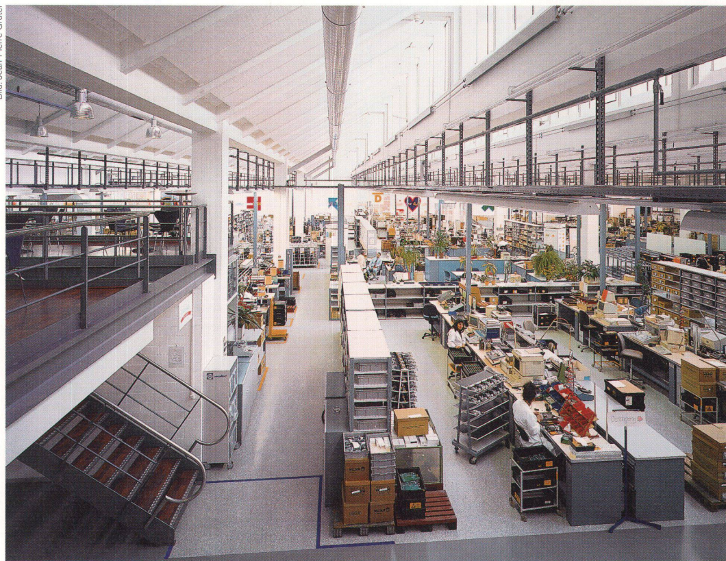
Die Fabrikhallen werden jetzt gemischt mit Büros und Labors genutzt