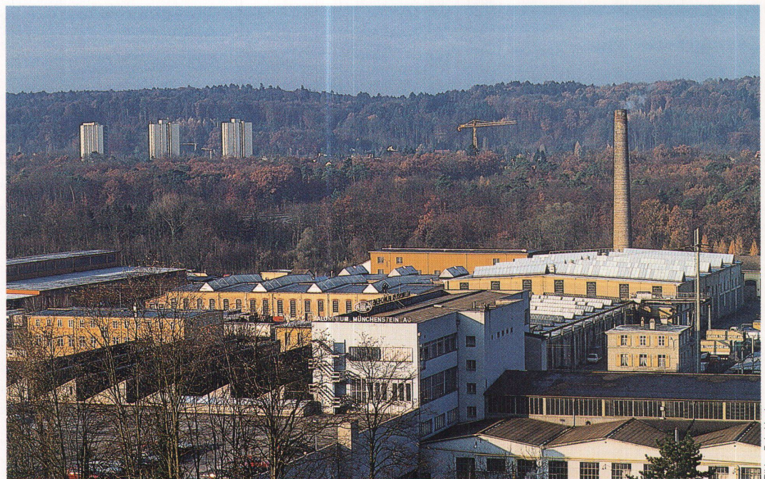
Das ABB-Areal in Arlesheim ist zur Zeit zu etwa 90 Prozent belegt