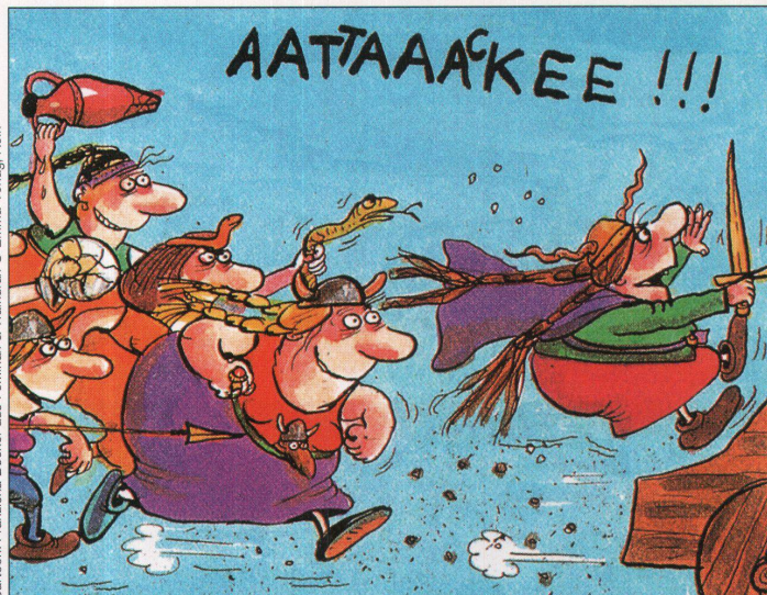
Cartoon: Franziska Becker aus Feminax & Walkürax © Emma-Verlag Köln

Leutschenbachstrasse 44 8050 Zürich Oerlikon Telefon 01 301 22 30 Fax 01 301 14 11