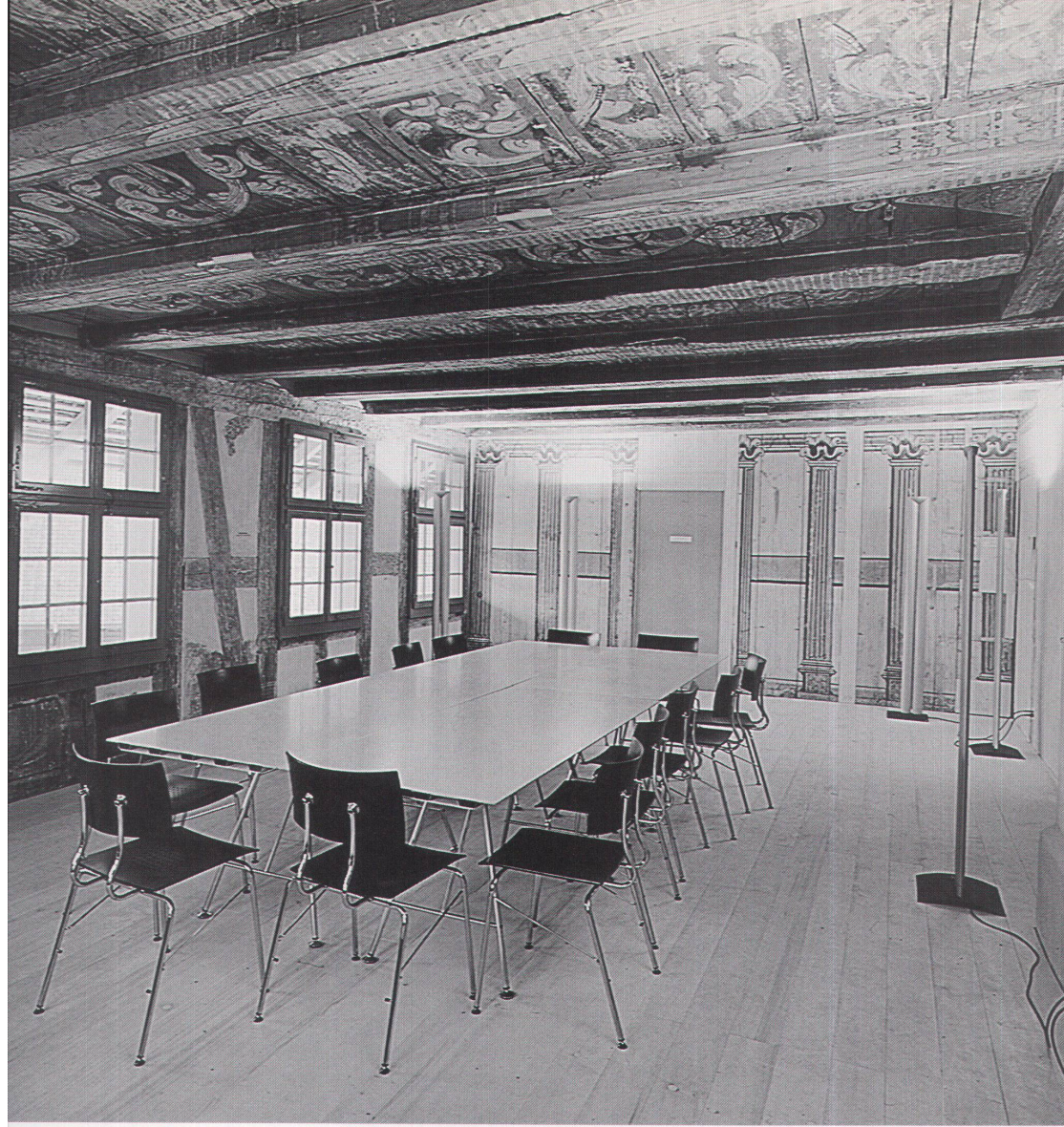
Der barocke Festsaal mit neuem Möbeldesign (Tische: Ueli Biesenkamp/Alinea, Stühle: Christoph Hindermann/Dietiker)