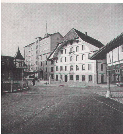
Die Mühle an der Langete im Wuhrgebiet