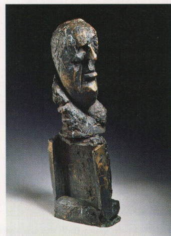
Portrait Mies van der Rohe in Bronze