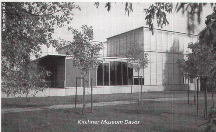
Kirchner Museum Davos

Telefon 052 728 81 11 Telefax 052 728 81 00