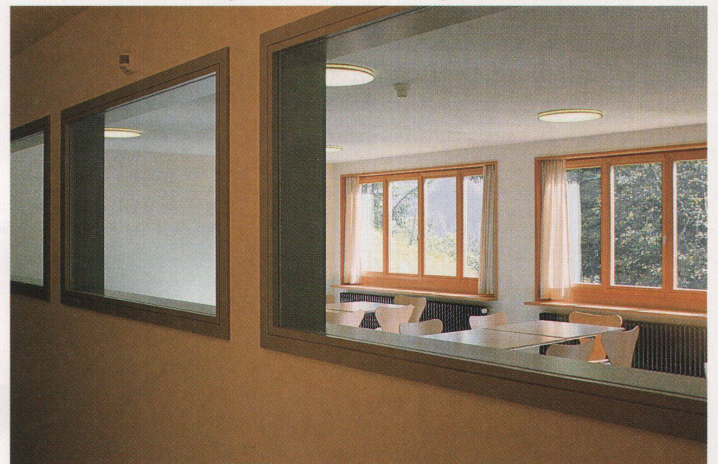
Blick vom Gang in den Essraum

Im Gegensatz zu einem Hotel pflegen die Jugendherbergen weiterhin ge- meinschaftlich genutzte Räume. Die Schlafzimmer werden auch in Zu- kunft nur mit einem kleinen Tisch und zwei Hockern ausgestattet sein, denn tagsüber sollen die Gäste in den Ess-, Spiel- und Leseräumen leben.