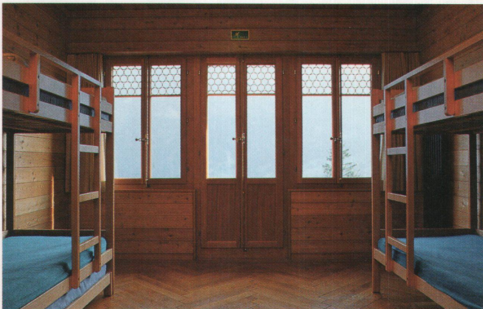
Schlichte Betten aus Lärchenholz stehen in Zwei- und Vierbettzimmern

Blicken wir noch auf die architekto- nische Ausführung des Neubaus. In