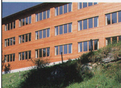
Südfassade mit im vervierfachten Modul angeordneten Fenstern

der Situation dominiert das renovierte Hauptgebäude, dessen Chaletfront über das Dorf Grindelwald blickt, während der Nebenbau zwischen den Bäumen ruht. Gegen Süden richtet sich der in Lärchenholz verkleidete Bau mit im vervierfachten Modul angeordneten Fenstern über das Tal zur Eigernordwand. Nur leicht nach innen versetzt, unterstützen die Fenster die feingliedrige 7 cm breite Stülp-schalung. Auf den Seiten und gegen Norden tritt das Fenster im einfachen Modul auf, um so Licht in die Nasszellen zu lassen. Durch das mattierte Glas der Dusch- und WC-Raumtüren dringt schwach das Nordlicht aus den Nasszellen in den Gang.