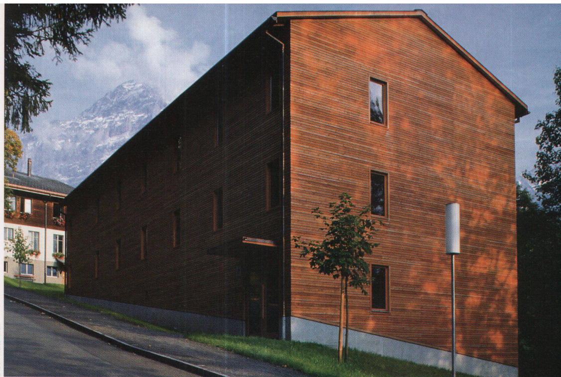
Gegen Norden und auf den Seiten tritt das Fenster im einfachen Modul auf, um so Licht in die Nasszellen und den Gang zu lassen