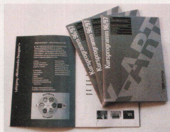
Kursprogramm zum «Multimedia Designer»-Lehrgang

Die X-ART, Schule und Ateliers für Angewandte Gestaltung in Glattbrugg, bietet ab Herbst einen neuen Lehrgang zum Thema «Multimedia-Design» an. Er umfasst einen dreitä-