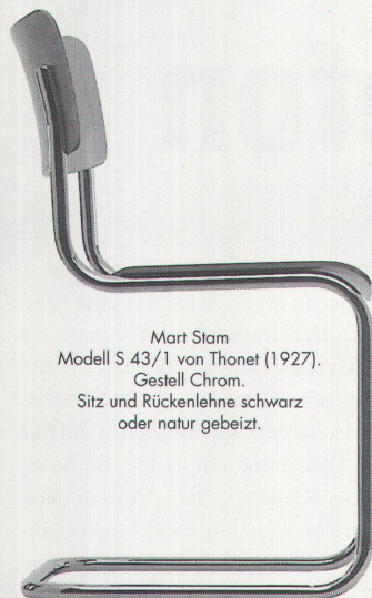
Mart Stam Modell S 43/1 von Thonet (1927). Gestell Chrom. Sitz und Rückenlehne schwarz oder natur gebeizt.

Ein Jubiläumsangebot, das Sie vom Stuhl reisst.