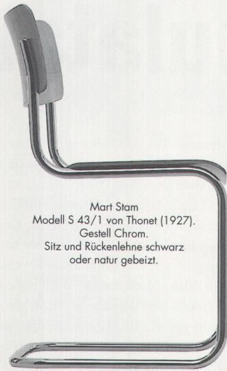
Mart Stam Modell S 43/1 von Thonet (1927). Gestell Chrom. Sitz und Rückenlehne schwarz oder natur gebeizt.

Ein Jubiläumsangebot, das Sie vom Stuhl reisst.