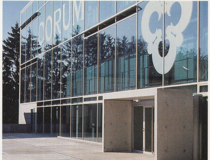
Das neue Corum Gebäude in La Chaux-de- Fonds von Althammer und Hochuli