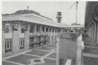
Die neue Moschee in Rom

In Rom wurde die grösste Moschee Westeuropas eingeweiht. Nach über 30 Jahren Wartezeit haben jetzt die römischen Muslime ihr Gotteshaus be-