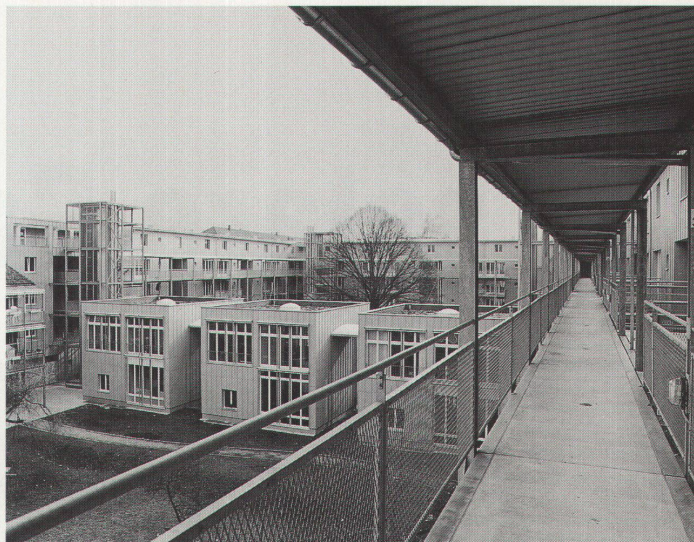
Die Wohnüberbauung Brahmshof in Zürich von Kuhn Fischer Partner