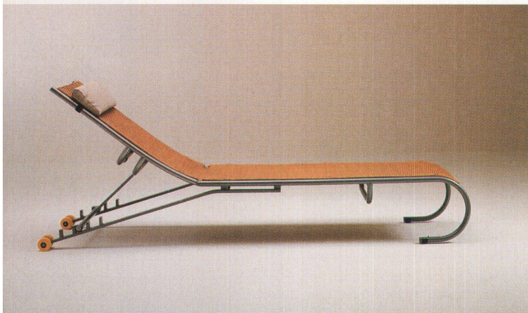
«Skate-Series» ist mit echten amerikanischen Rollschuhrollen bestückt

Auch der bequeme Sessel für gemütliche Lesestunden muss nicht immer in der selben Wohnzimmerecke stehen. Denn wer sitzt an lauen Sommerabenden nicht auch mal gerne vor der offenen Balkontüre oder kuschelt sich während des Monumentalfilms vor den Fernseher. Mit dem Sessel «Small room» von Burkhard Vogtherr für die italienische Firma Cappellini ist das möglich. Zwei Rollen aus massivem Buchenholz sind anstelle der beiden hinteren Sesselbeine angebracht. Will man den Sessel verschie-