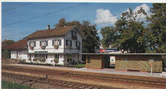
Links der ehemalige Bahnhof, rechts der neue Pavillon

Konstruktion: Wände: massive Backsteinwände, SSB-rot gemalt, Lamellen aus Fichte; Dach: auf Sparren geschraubte 3-Schichtplatten aus Fichte (B/C Qualität), alle Holzteile hell lasiert