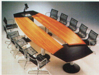
Das ausgezeichnete «Zoom-Meeting»

Die «Best of NeoCon-Competition» in den USA gewann ein Schweizer Unternehmen. Das Konferenzsystem «Zoom-Meeting» von Mobi-