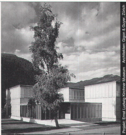
Projekt: Ernst Ludwig Kirchner Museum Architekten: Gigon & Guyer, Zürich

Ästhetik, Wirtschaftlichkeit und bauphysikalische Anforderungen in Einklang zu bringen, ist das Ergebnis ausgereifter Konstruktionen. Qualitätsbewusstsein und partnerschaftliche Zusammenarbeit sind nur einige der Voraussetzungen für ein gutes Gelingen in dieser vielfältigen Branche.