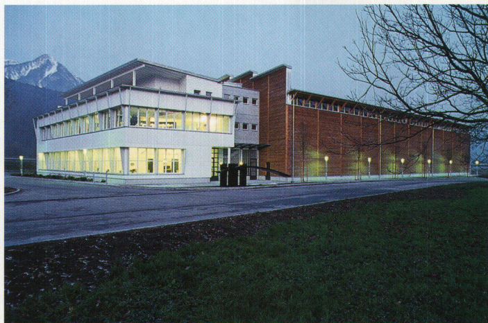
Parqueterie Durrer in Alpnach – Architektur in der Gewerbezone