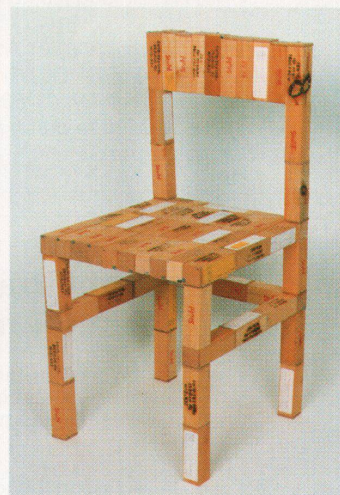
Der «freiburger stuhl-stuhl» besteht aus kleinen Holzbehältern, die für Laboruntersuchungen des Stuhlgangs von Patienten in Spitälern verwendet wurden