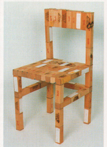
Der «freiburger stuhl-stuhl» besteht aus kleinen Holzbehältern, die für Laboruntersuchungen des Stuhlgangs von Patienten in Spitälern verwendet wurden

Info: galerie blau, Dorfstrasse 8, D-79280 Freiburg, 0049 / 761 40 78 98.