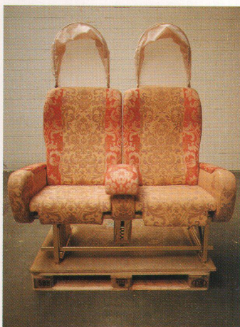
Der Stuhl mit Haube wurde von Matteo Thun und Carlo Canervo umgestaltet