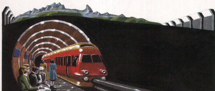
Illustration: Sambal Delek