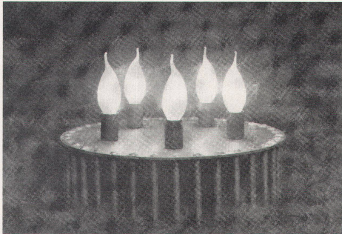
Eine Geburtstagstorte ganz im Stil der Neuen Werkstatt

Kürzlich war Geburtstag: Die Neue Werkstatt, eine Gruppe von drei Gestaltern, feierte ihr fünfjähriges Jubiläum. Es gibt ein interessantes und vielfältiges werdendes Werk zu besichtigen, das sich vom kleinen Schmuckstück bis zu grösseren Arbeiten in Raum, Möbel und Licht erstreckt. Eine Reportage von Adalbert Locher über Handwerk, Material, Form und Angemessenheit.