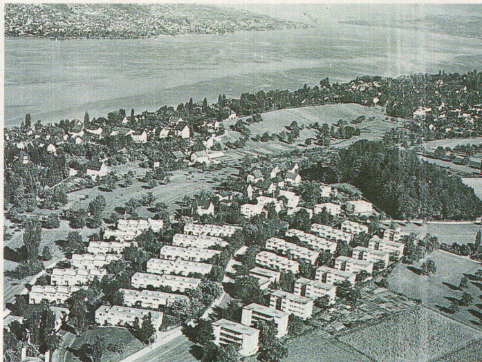
Ein Wohnmodell aus der Vergangenheit: die Werkbund-Siedlung Neuböhl in Zürich

Die Zielsetzungen des SWB, die sich von der «Veredelung der gewerblichen und industriellen Arbeit» des Anfangs über das «Neue Bauen» in den Zwanziger- und Dreissigerjahren zur «Guten Form» der Fönfziger- und Sechzigerjahre entwickelte, gehen dahin, die «für ein verantwortungsbewusstes Gestalten notwendigen Auseinandersetzungen anzuregen und zu vertiefen». Dieser Thematik ist auch die Jubiläumstagung gewidmet: «Gestaltung in der Rezession – eine Bewegungsraumbesichtigung».