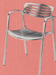
LOTZNER UND PARTNER BASEL

q u ä l e d e i n e n h i n t e r n n i e z u m s c h e r z, d e n n d e i n h i n t e r n f ü h l t w i e d u d e n s c h m e r z.